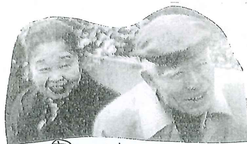
恵の歴史ここにあり!! 会長夫妻

手作り、手書きが大スキな事務員。 犬が大スキで大スキしかたのない女子(笑) ・愛犬家住宅コーディネーター ・ペットヘルパー2級 ・愛犬救命士 ・犬の在宅看護師 ・ホリスティックアカデミー Megumagaのこと、犬猫のこと、どしどしご質問ください。 特に老犬の介護やお悩みへのアドバイスが得意分野です。