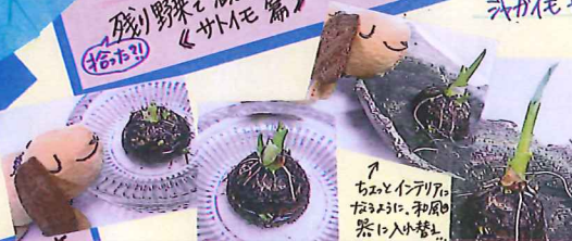
↑ ちよとイモの、 たすおに、和風 茶に入外替...