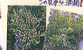
5/1 ついでに 小庭のカワイイ