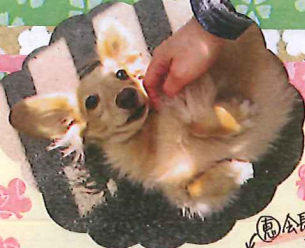
会長撮影 新宿御苑の桜