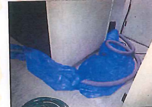
↑このホースの先に作業員が入っていますが、映像はカットで(笑)

有毒ガスの危険性や激しい汚れ。誰もやりたがらない、そして表舞台には出ない大変な仕事。でも絶対に社会になくてはならない大切な仕事。